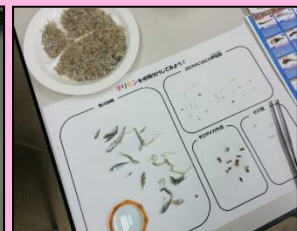
↓運がいいとこんな生き物も！