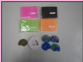
↓完成品(マグネット付き)

本物のアンモナイトからとった型で、簡単にレプリカが作れます。ストラップやマグネットに加工することもできます。化石クイズを合わせれば、君も化石マスター！