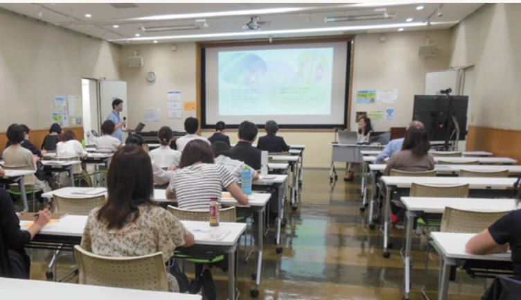
青少年理解の研修

青少年に関わる人が必要な知識・スキルを学ぶ機会を提供しています。また、相互に学ぶ機会も提供することで、青少年育成における連携・協働を促進しています。