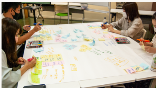
若手スタッフがふりかえられる場