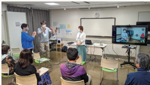
スマホで作る動画作成講座