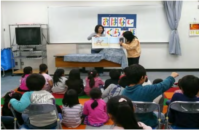
コミスクとの協賛でお話サランボに参加しました。大きな紙芝居や変わった絵本にみんなくぎ付けでした。