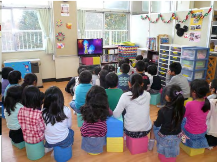
キッズシアターの様子です。12月は、クレヨンしんちゃんオラの引越し物語を鑑賞しました。