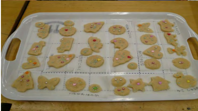
十二月十四日料理教室 米粉でクリスマスケーキを作りました クリスマスにちなんだ本の読み聞かせです。