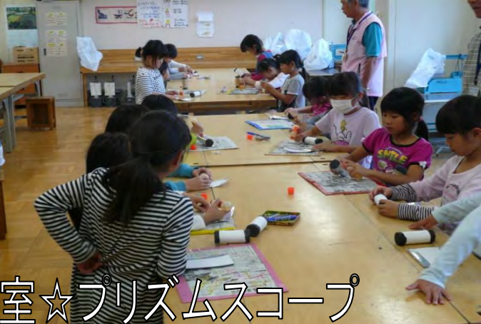
工作教室☆プリズムスコープ