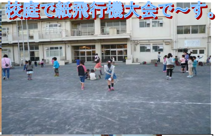
校庭で紙飛行機大会で～す。