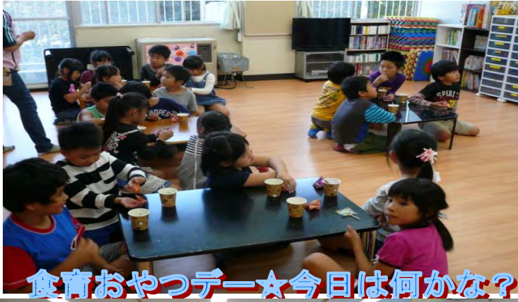
食育おやつデー☆今日は何かな？