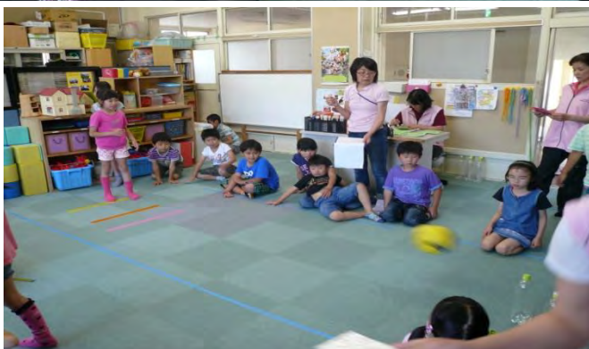
ペットボトル・ボーリング