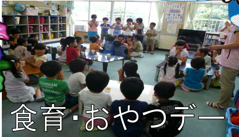
食育・おやつデー