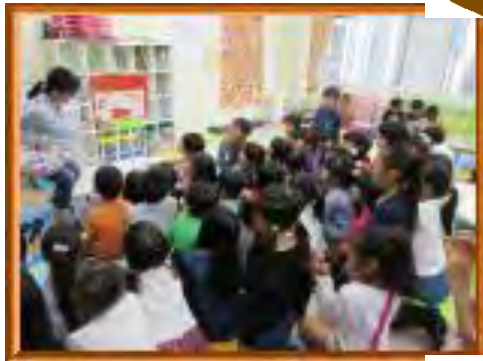
9/3 絵本の読み聞かせ