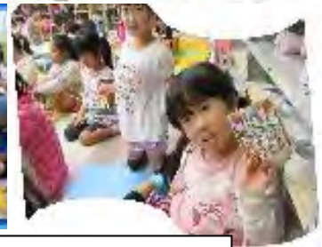
8/26 楽しいビンゴ大会