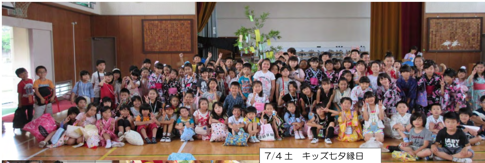
7/4土 キッズ七夕縁日 景品いっぱいゲットしたよ