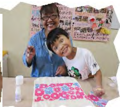
7/11 保護者会 お話の後、お母さんたちが デコパージュに挑戦!