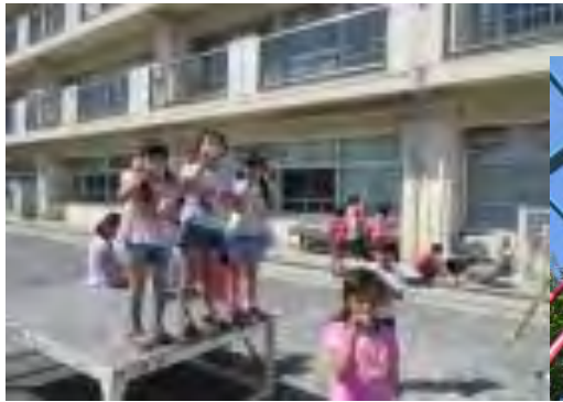
校庭でシャボン玉、登り棒など