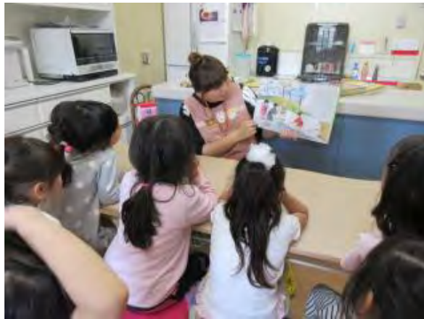
4/27 絵本の読み聞かせ