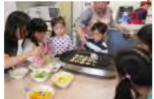
4/28 キッズキッチン（バビーカーステラ作り）