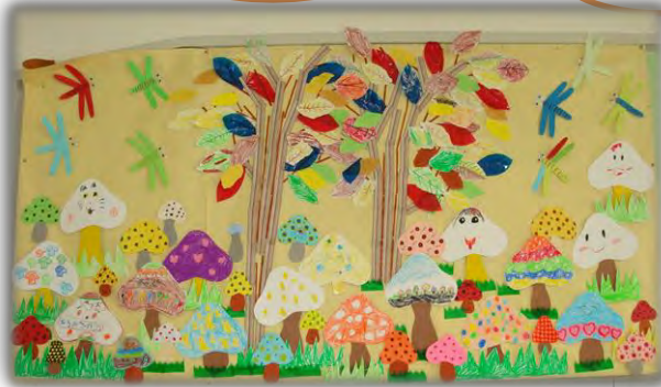
♪森のきのこたち♪完成（秋の壁面）