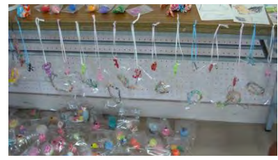
作 ゲーム大会用の景品づくり（手作り）