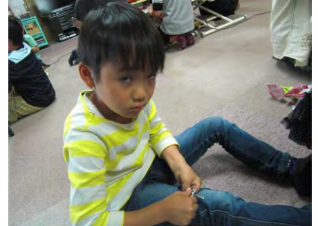
【キッズルーム】にて カブラやドミノでなんでも作ります。 「自分たちより高くなったよー！」 「これ、教会ね」 「どう、すごいでしょ？」