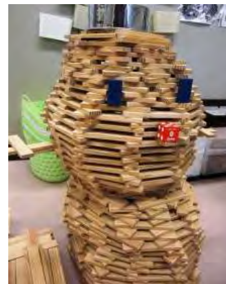
【カブラの雪だるま】

「新鮮だよ〜、サーモンがおすすめ!」タスキがけをした職人さんが自信をもっておすすめします。