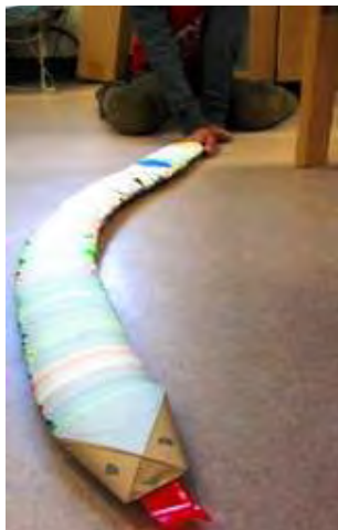
【おりがみコップのへび】