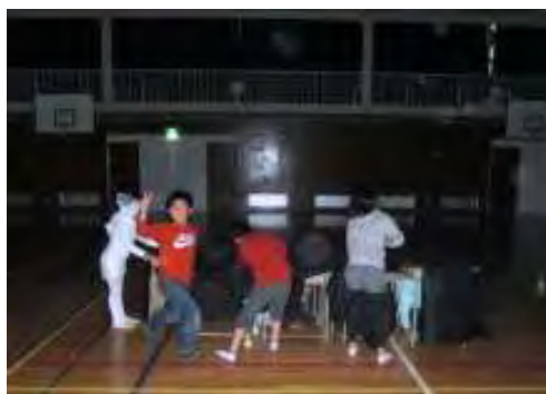
高学年の企画運営チーム、シカケ屋さん。

カブラ(つみき)で、球を作るという技に、かわいい顔をプラス☆「ここに赤い鼻をつけて…」傑作ができあがりました。