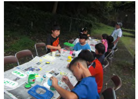
アスレ もり の森 き の木の着板 かんばん も作 つく ったよね。 「の」が おお 多くて変 へん だね。