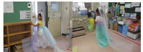
きれいな衣裳 いしやう も着 ま られてご満悦 まんえつ だったね。