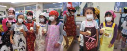
おいしいオリジナルパフェも作 つく ったよね。