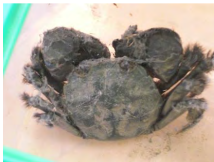
学校 がっこう 裏 うら で めちゃくちゃ大きなカニを見 み つけて 鍋 なべ づくり…はしなかったけれど、 びっくり仰 きょう 天 てん もしたね。