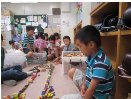
ながーいドミノ どみ ノも作 つく ったね

悪い わる こともたくさんし し ちゃったね。 来月 らいげつ はしっかりル まも ールを守 まも ろうね。