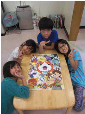
おおきなパズルも作 つく ったね。