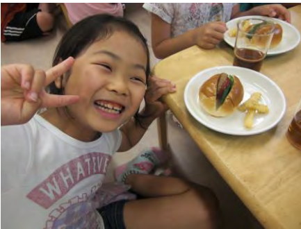
ハンバーガーとポテト！

4年生の女の子を中心に ファンルームアクセスを企画。 マンツーマンの丁寧な指導。 驚きの満足度120%！