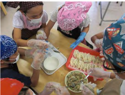
こねこね つつみつつみ やきやき もぐもぐ… ぐっ♪