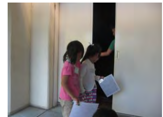
四葉の入った、幸運の下敷きと 幸運の葉をゲットできたかな？