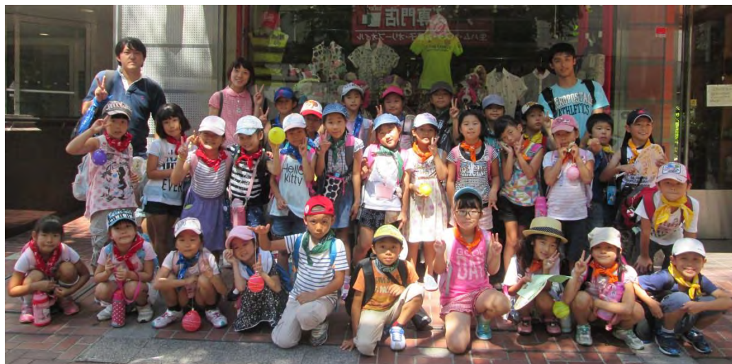
ま ぎ ず な 夏 祭 い