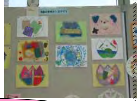
区役所のロビーにみんなの作品がかざられました