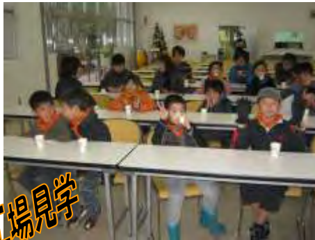
もいなが工場見学