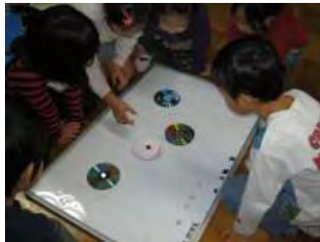
CDごまを作ってまわそう

お知らせ 冬休み前にキッズの上ほきを持ち帰って、洗ってください。 サイズ小さくなっていましたら、替えてください。