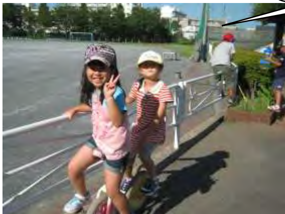
一輪車にちょうせん