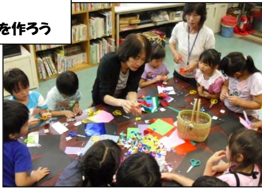
7月2日(月) ペーパークラフト教室 七夕飾りを作ろう