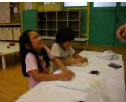
☆パン作り☆ 小さな職人の誕生です♪