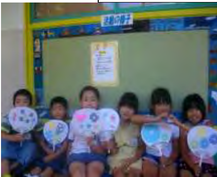
☆うちわ作り☆ 涼しげで素敵だね♪