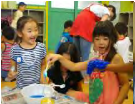
☆スライム☆ うわ〜!何だこれは!!!