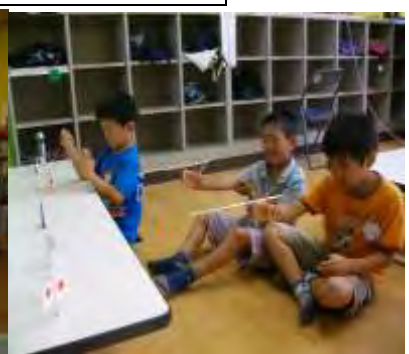
☆割りばし鉄砲☆ 狙った的は外さない!!!