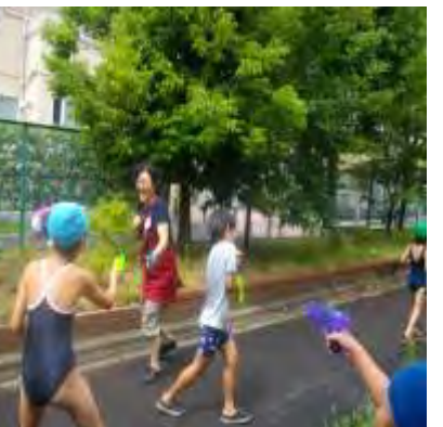
☆水鉄砲 de 遊ぼう☆ 攻撃開始〜!!!