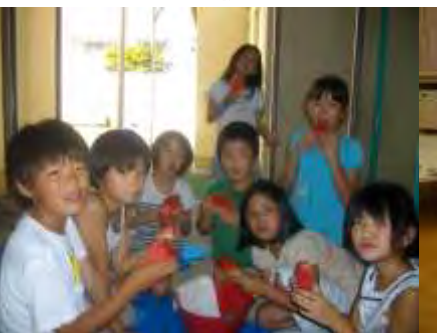
☆スイカわり☆ 3年生が大活躍してくれました★