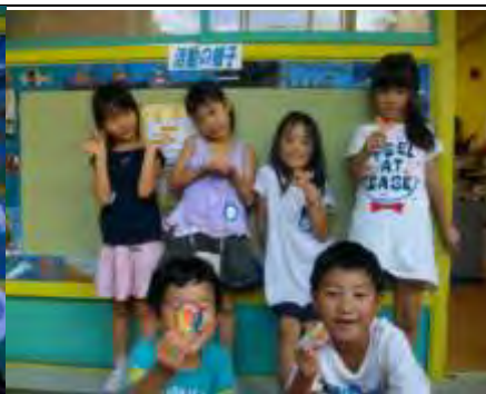
☆アイロンビーズ☆ 色とりどりの宝物ができたよ★