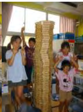
☆カプラ☆ カプラタワー! カプラサーキット!