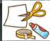
ぴょんと飛ぶおもちゃをつくったよ☆