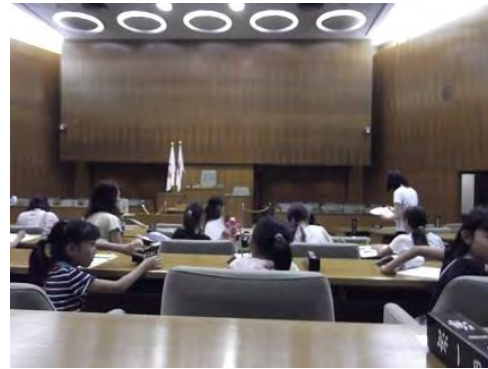
【こどもアドベンチャー】市議会を見学。 「議員席ってふかふかだね」「あ、動いた」