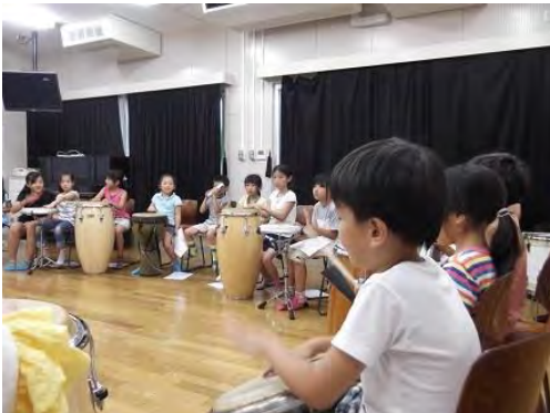
【ドラム体験】ジャム音楽学院の講師のみなさんがどんどん盛り上げてくれます。「みてみて! こんだよ!」