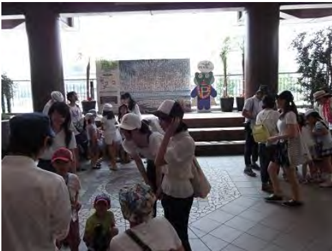
【横浜たんけんたい!】アクションポート横浜とシティガイドのみなさんと一緒に探検です。 「次はどこかな?」「あれは何かな?」