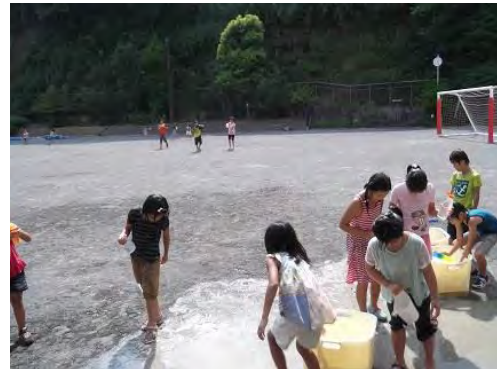
【水合戦】「冷たい!」「もっと水かけて!!」 「紙風船つぶししようよ!」「競争しよう~」