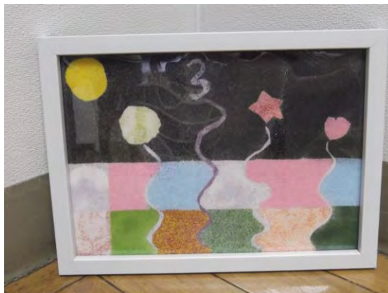
【じゅくりくわ】の作品です。