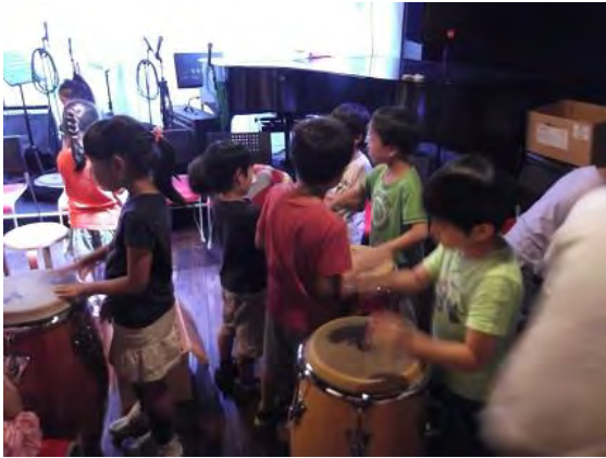
横浜ジャム音楽学院さんの「どんどこドラム体験♪」 「楽しかった!」「太鼓を叩けたよ」とのこと。 楽しい時間をありがとうございました。

水筒やプールバッグなど、持ち物の増える季節になりました。それとともに、忘れ物が多くなる季節にもなりました。まずは、忘れ物をしないことはもちろん、持ち物にしっかりと名前を書いていただくよう、お願いいたします。名前があれば、お返しできます。「忘れ物箱」が空になるよう、みんなで気をつけていきましょうね。