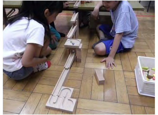
ビー玉ころがし 久しぶりに広げた「ビー玉ころがし」 次々と工夫のつまったコースができあがりました!