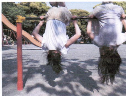
■探検キッズがゆく■

今回は近隣公園めぐりへ。 「あ、すべり台がさかさま…」 「ほんとだあ、のぼっていくねえ」