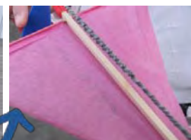
ゴムをぐるぐる巻いて...