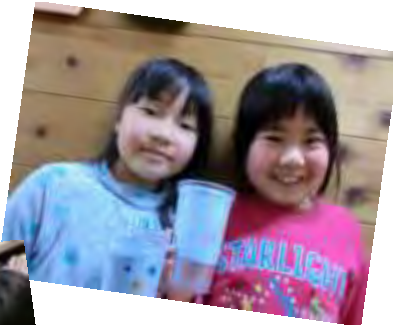
ブラコップペン立て