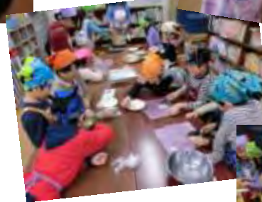
進級カレーパーティー