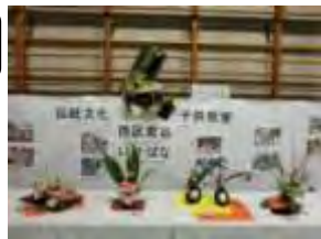
2月のキッズの様子