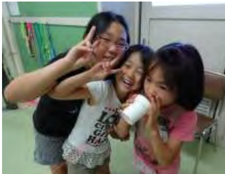
7/25 おやこDEキッチン&保護者会 パンケーキおいしくできたね！