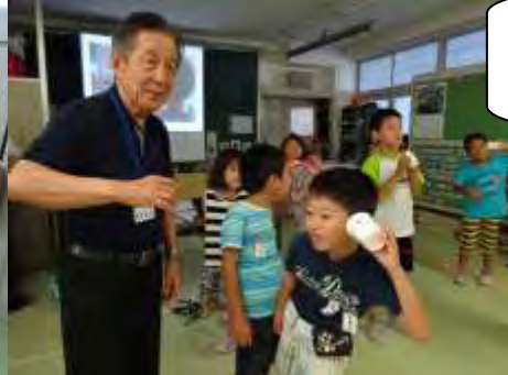
7/15 かながわ子ども教室《糸でんわ》