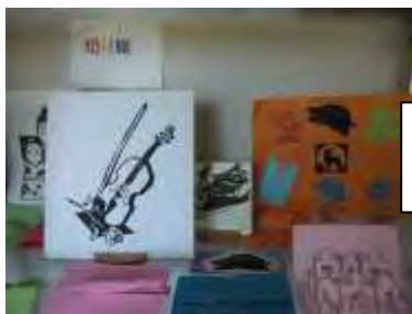
← きりえ (月2回) みやたせんせい 宮田先生