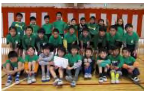
ドッジボールクラブ (月3回程) たいかい 大会に向けて、 む 練習します！ れんしゅう