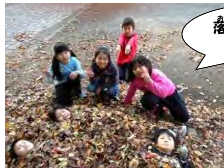
み落ち葉のベッド♪