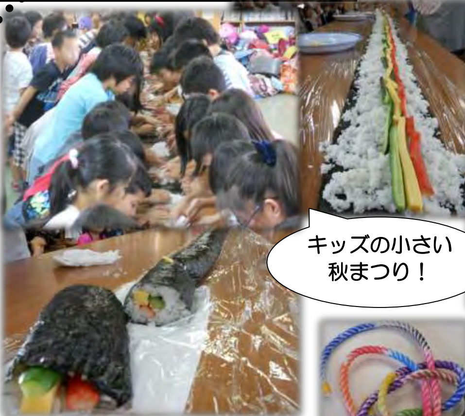
キッズの小さい 秋まつり!