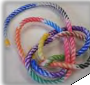
わくわくクラフト