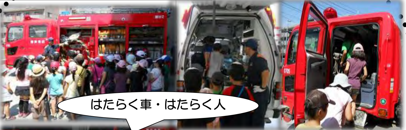
はたらく車・はたらく人