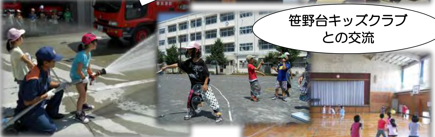
笹野台キッズクラブ との交流