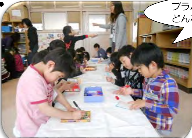
プラバンづくり！ どんな絵を書こうかな？