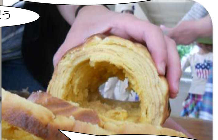
親子でバウムクーヘン 美味しそうに焼きました！