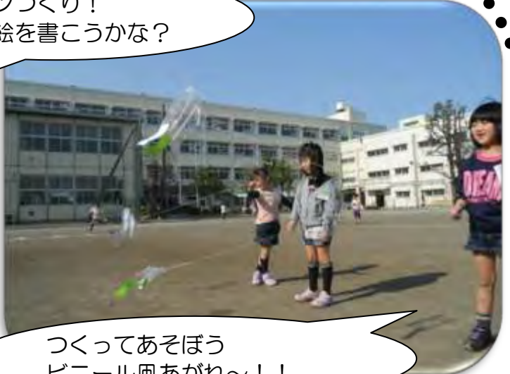
つくってあそぼう ビニール凧あがれ～！！