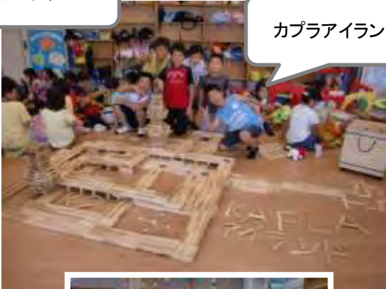
カプラアイランド♪