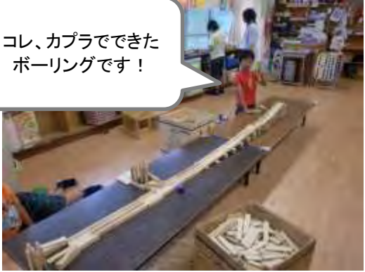
コレ、カプラでできた ボーリングです！