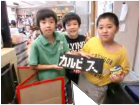
カルピスおいしいよね～