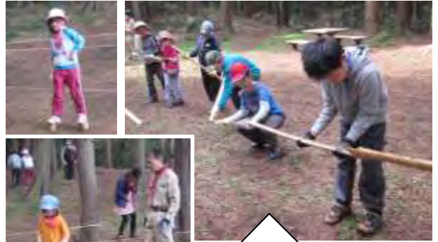
ナイアガラの竹 ～ ビー玉リレー ～