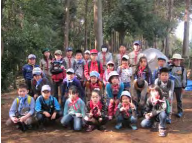
3月29日(土) BS デイキャンプ ～矢指の森で遊ぼう! 『竹取物語』～