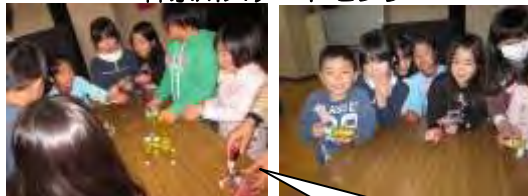
手動で動くロボット