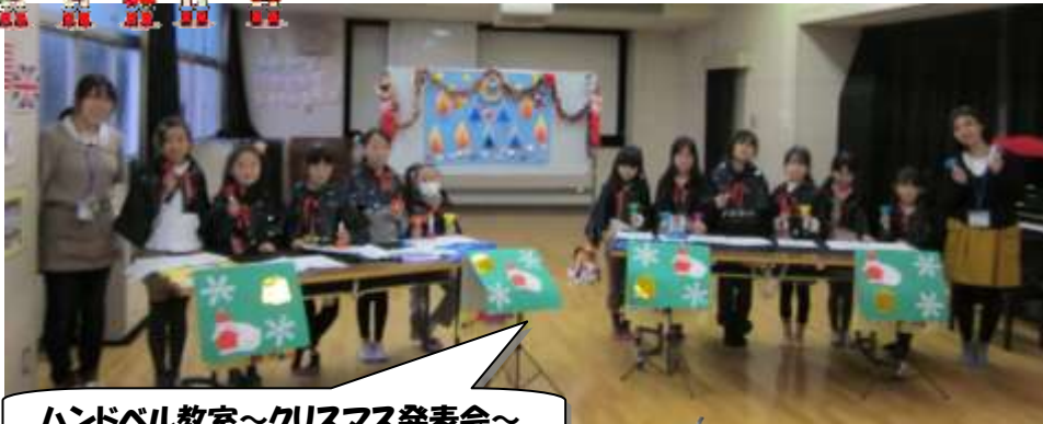
ハンドベル教室～クリスマス発表会～