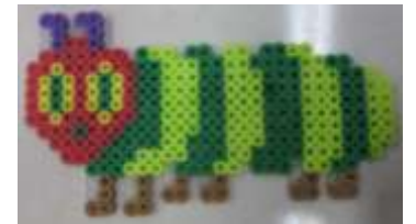
パンケーキデコレーション