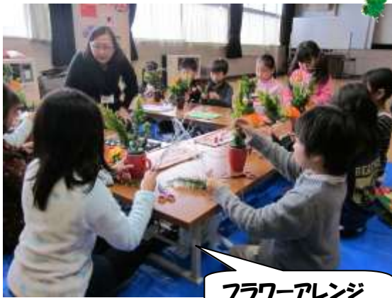
フラワーアレンジ