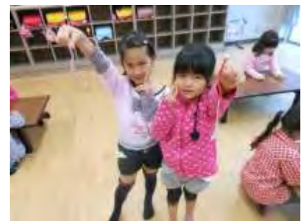
11月26日(火) NPO 私たちと水