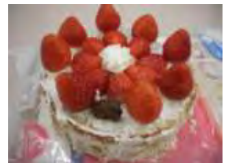
クリスマスケーキ