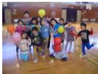
芋煮会&バドミントン