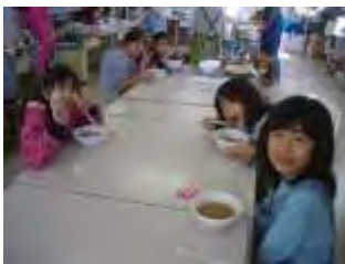
芋煮会&バドミントン