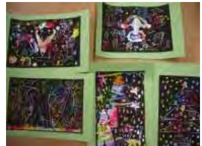
スクラッチアート