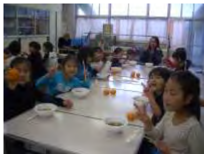
ミニ運動会 & 芋煮会