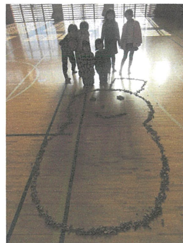
ちいひくかん 体育館に糺い込んだ落ち葉で作ったよお(*^▽^*)♪