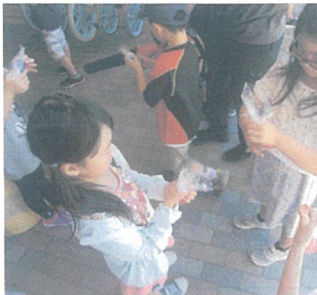
* スライム *