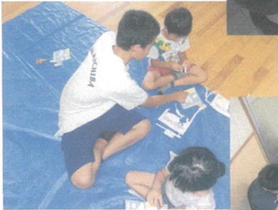
* 暑中見舞いカード *