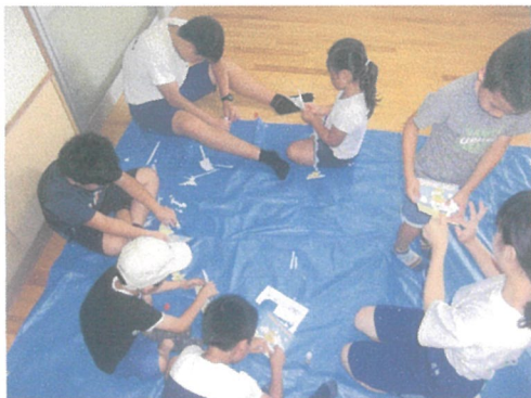
暑中見舞いカードづくり

★今年度も十中交流事業で夏ボラに来てくれた中学生がボランティアのあとに遊んでくれました(*'▽')♪