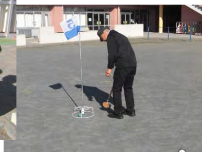
めっちゃ楽しかったぁ~(*^▽^*)♪