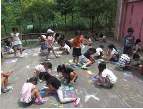
落書き大会の様子(#.~#)