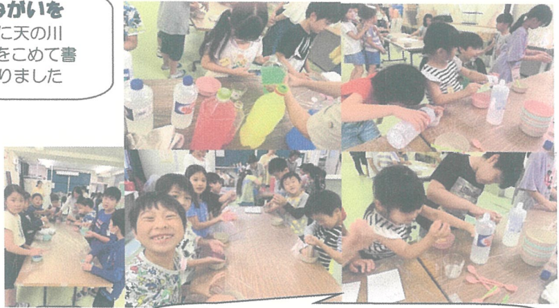
音も楽しいスライム作り6/24・25