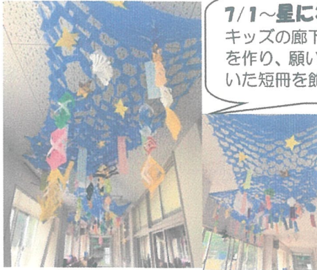
7/1～星にわがいを キッズの廊下に天の川 を作り、願いをこめて書 いた短冊を飾りました

E-mail terao-kids@image.ocn.ne.jp TEL&FAX 045-583-8106 2017年 8月号