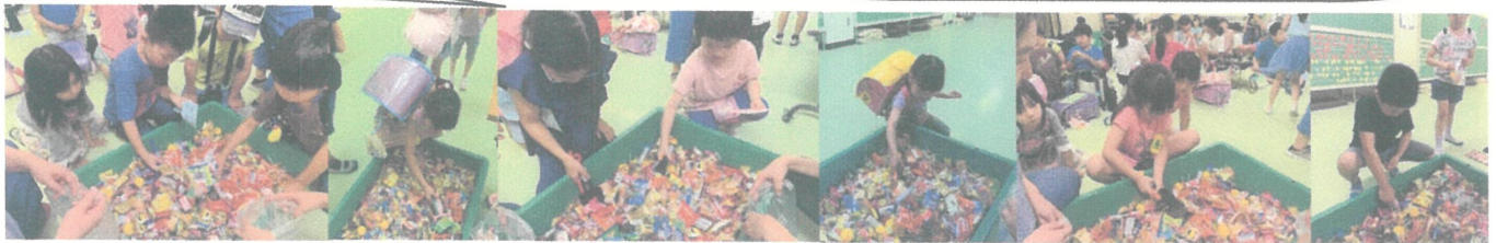
6/20 山もいのお菓子で お菓子のすくい