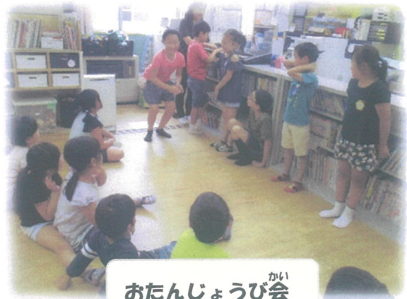
おたんじょうび会