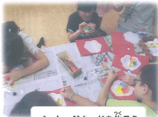
メッセージカードを作ろう