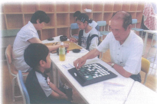
はっぴーくらぶさんと囲碁・将棋