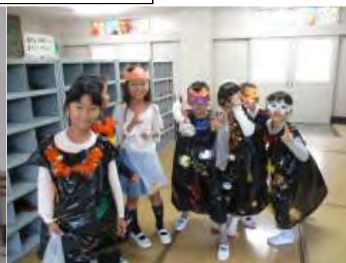
☆ハロウィンパーティー☆